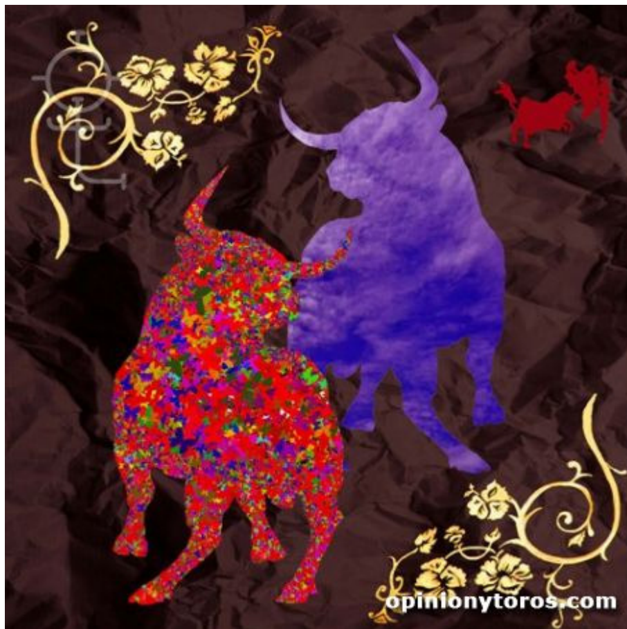
Garabato, de José Manrubia "Pepe", año 2005

Fue el artista escogido de muchos otros para el cartel de las Ferias de Bayona 2010 con el toro espacial hecho de mariposas y en el fondo la plaza de Bayona, Lachepaillet. Para mí, el más bonito y poético cartel de las plazas francesas del 2010. A los empresarios que quieran un cartel original para el 2011, vean sus obras en http://www.josemanrubia.com/