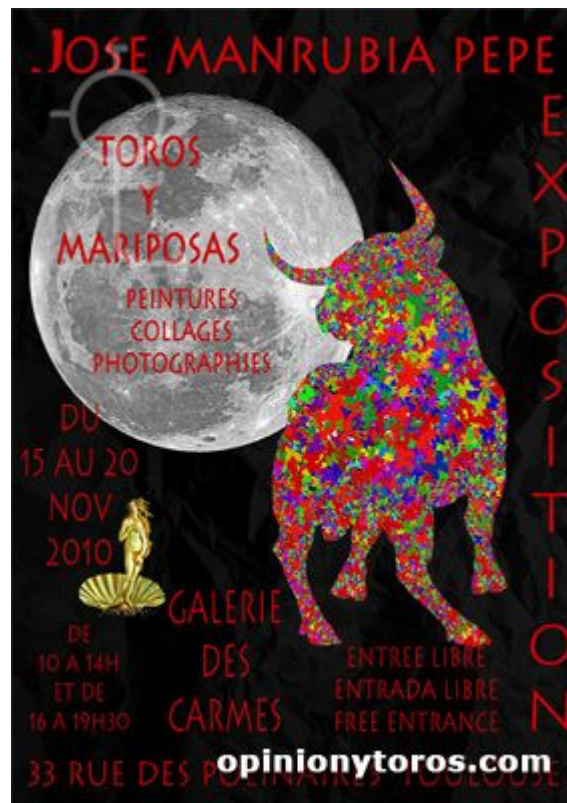
Cartel de la exposición "Toros y Mariposas"