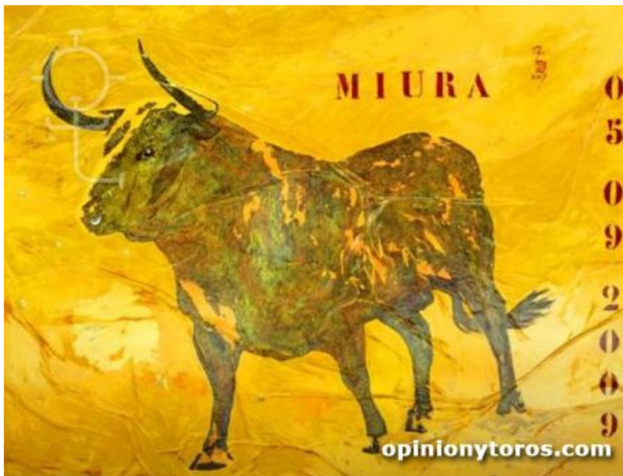
Miura, de José Manrubia "Pepe", año 2009

Toreó 3 veces de novillero en La México y tomó, para concluir este ciclo, su alternativa un 6 marzo 1994 en ciudad Guadalupe , municipio de la zona metropolitana de Monterrey (Nuevo León, México), de manos de Manolo Mejía, testigo Adrian Flores y toros de Yturbe Hermanos. Es el primer y también el único matador galo que tomó su alternativa en las Américas.