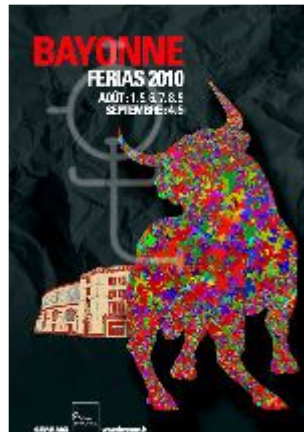
Cartel de las Ferias de Bayona 2010 por José Manrubia "Pepe"

escultor, y lo hizo con mucho talento. Presentó una gran cantidad de exposiciones en Francia, España (Valencia), México y Estados Unidos.